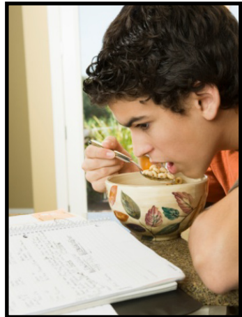
Sugerencia #2 – Que el estudiante tome un desayuno durante cada día del examen.